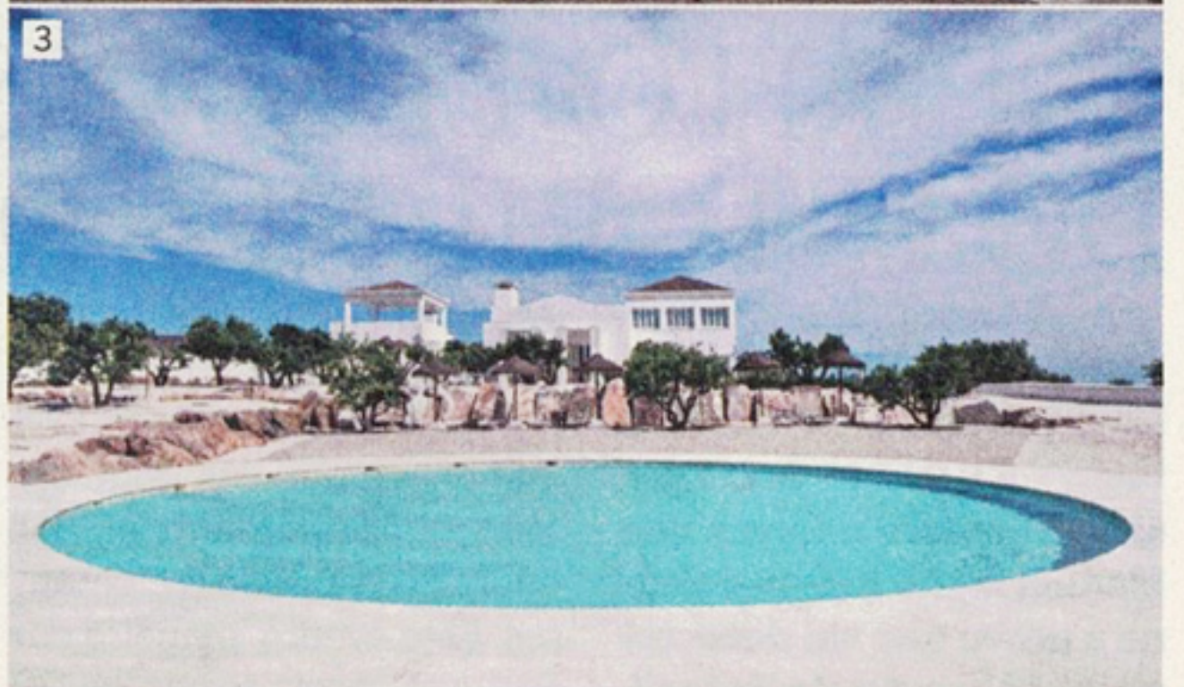
1. HOTEL PERMITE APRECIAR AS PAISAGENS ALENTEJANAS SOBRE A SERRA D'OSSA 2. A LUZ INUNDA OS QUARTOS, CADA UM DELES DECORADO COM PEÇAS DIFERENTES 3. SÃO DUAS AS PISCINAS DISPONÍVEIS NO EXTERIOR DO ESPAÇO TURÍSTICO. NO INTERIOR ENCONTRAM-SE MAIS DUAS, LIGADAS ÀS SUITES E COM ÁGUA SALGADA