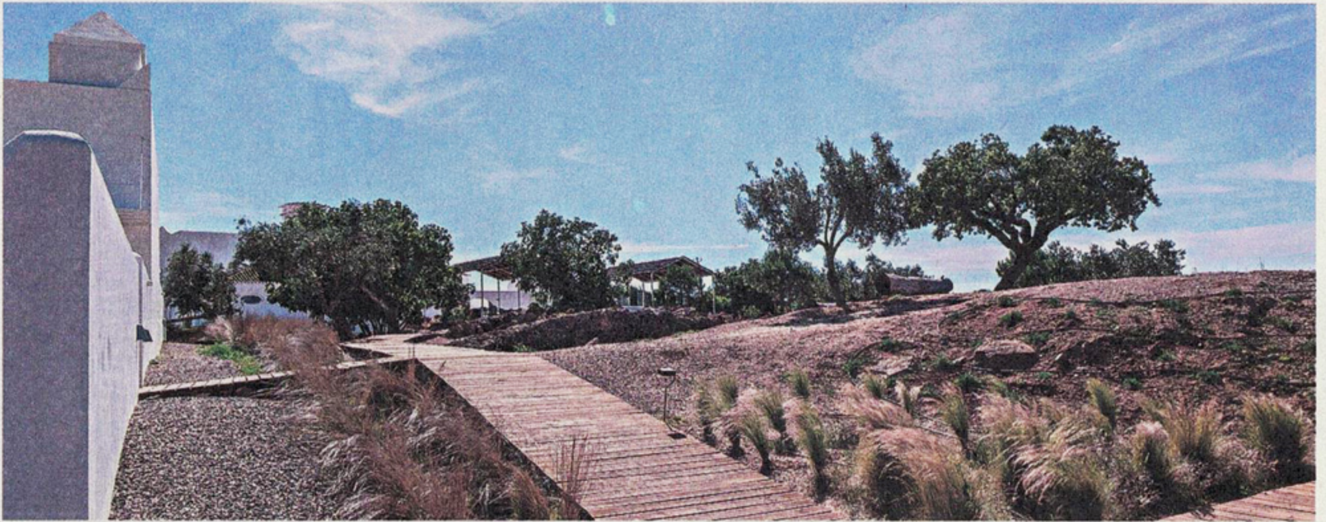
UM TERRENO COM 120 HECTARES QUE PERMITE DESFRUTAR DE UMA EXPERIÊNCIA DE AGROTURISMO ONDE A ARTE E A NATUREZA SE COMPLETAM

ção das matérias-primas da região que exporta o mármore. A cultura de trabalhar esta matéria e torná-la objeto não era comum, mas há cerca de um ano que ali virou tendência.